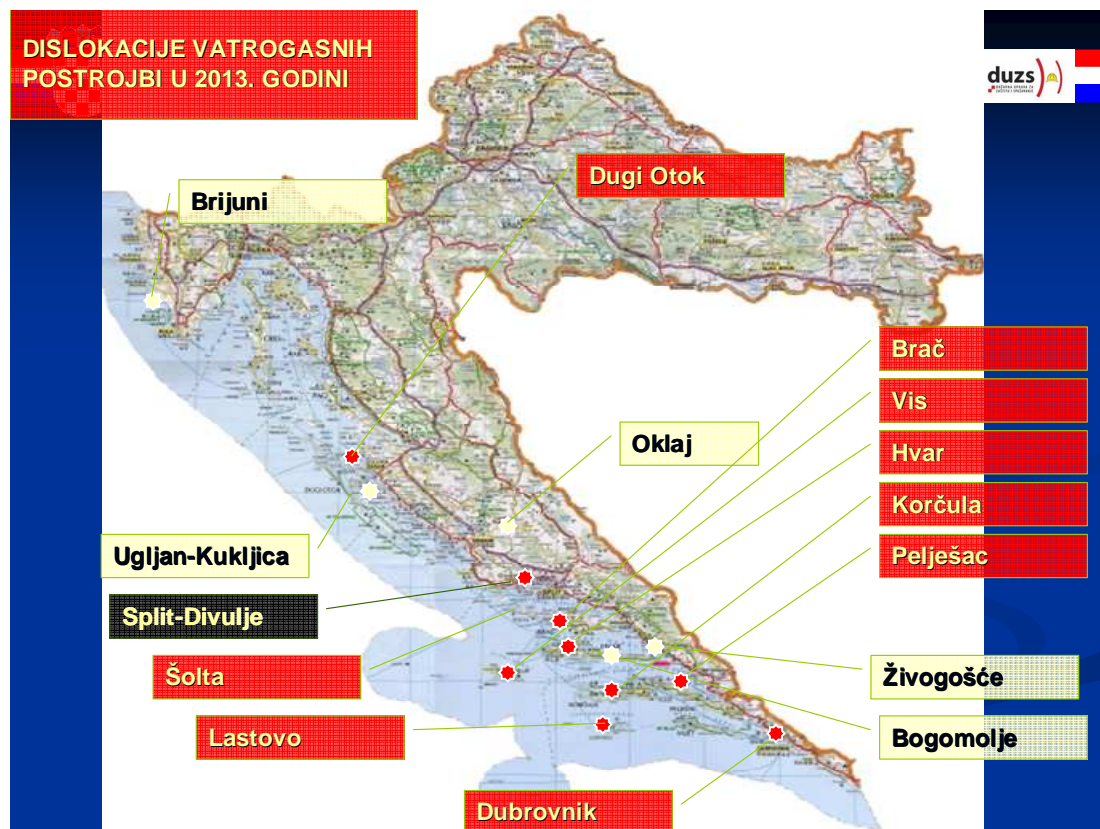
Slika 1: 15 lokacija priobalja na kojima su bile smještene dislokacije